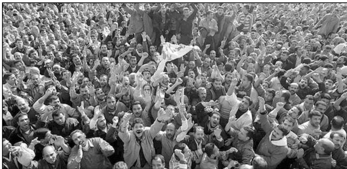
Пепел Тахрира стучит в сердце египтян

Однако подобное заявление в устах египетского генералитета более чем характерное. Командный состав армии явно заявил о своем стремлении перевести уличный демократический «площадной» протест, выходящий ныне за узкие рамки представительной демократии,