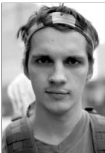
АГОНИЯ ЛИБЕРАЛЬНОГО ПРОТЕСТА

По сравнению с началом года, протестная активность существенно упала и продолжает падать. Заклинивания либеральных СМИ, твердящих про то, что активность людей «хотя бы не падает», лишние тому подтверждение.