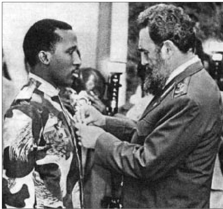
Фидель Кастро вручает орден Хосе Марти революционеру и руководителю Буркина-Фасо капитану Томасу Санкаре (1984г. или 1985г.) своей колонии, не нравится молодой офицер-радикал в правительстве.

В сентябре 1981 года Санкара, назначенный Государственным Секретарем по Информации в военном правительстве, удивил своих коллег по кабинету тем, что приехал на первое же заседание на велосипеде. Однако уже в апреле Тома оказывается в оппозиции военным, которые, по его мнению, проводили антирабочую политику. Следующий во-