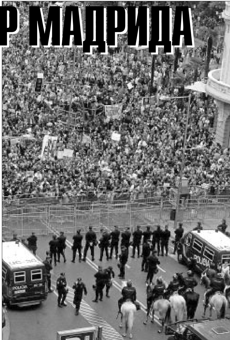
Протестующие против капитализма на улицах Мадрида едва не захватили парламент

Недовольство испанцев, утверждающих, что «кризис украл у Испании демократию», вызвано не только самими мерами по урезанию госрасходов и сложившейся финансово-экономической ситуацией, но и, в частности, рекордной для Евросоюза безработицей. Манифестанты не скрывали, что возмущены политико-экономической системой в целом, причём не только в Испании, но и во всём Евросоюзе. По их мнению, именно эта система порождает социальное неравенство, что наглядно проявилось и в Испании, и в других государствах ЕС, столкнувшихся с кризисом: выплачивать чужие долги при-