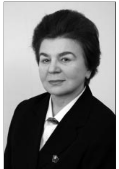
Н.А. АНДРЕЕВА, Генеральный секретарь ЦК ВКПБ.

Профсоюзные же лидеры, видя, что пресловутый «Рот Фронт» не состоялся и не су-