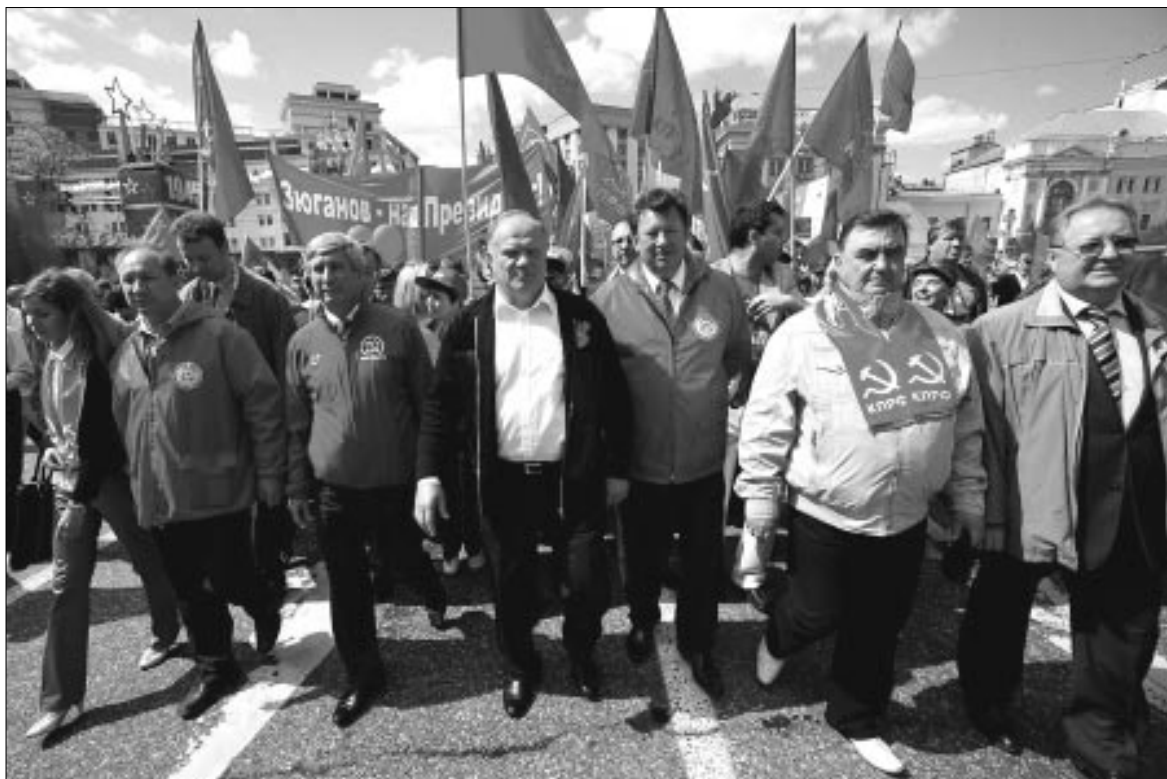
Массивный авангард партийной верхушки КПРФ.