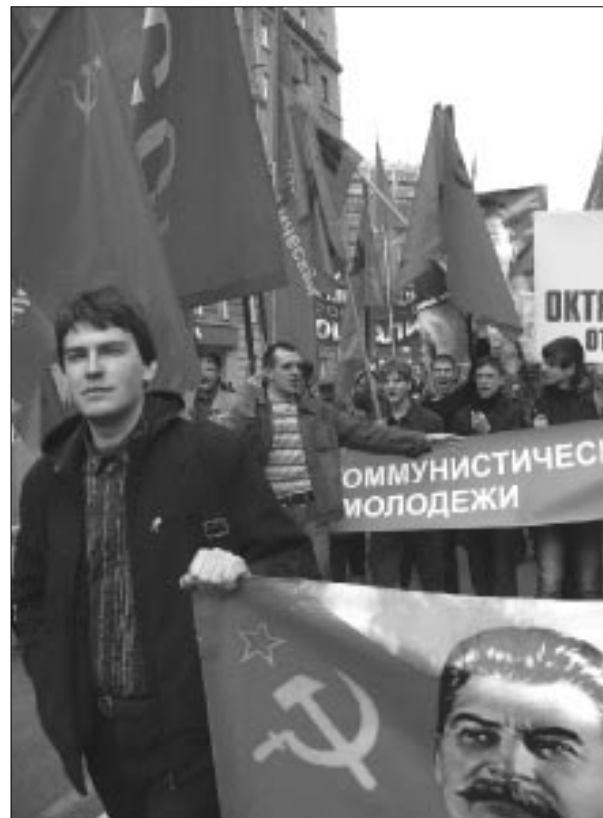
Молодежь «ТР» в колоннах Первомай в Москве (слева) и Новосибирске. 2011 год.