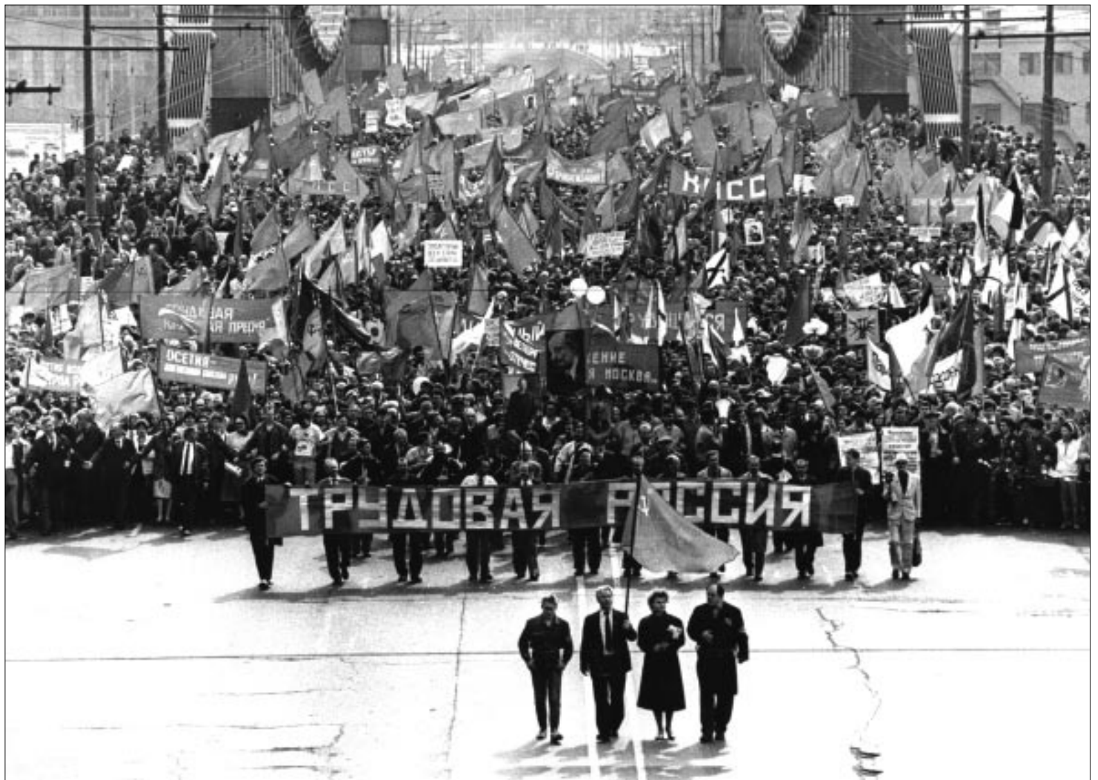
Стотысячная манифестация «Трудовой России» в Москве. 1 Мая 1992 года.