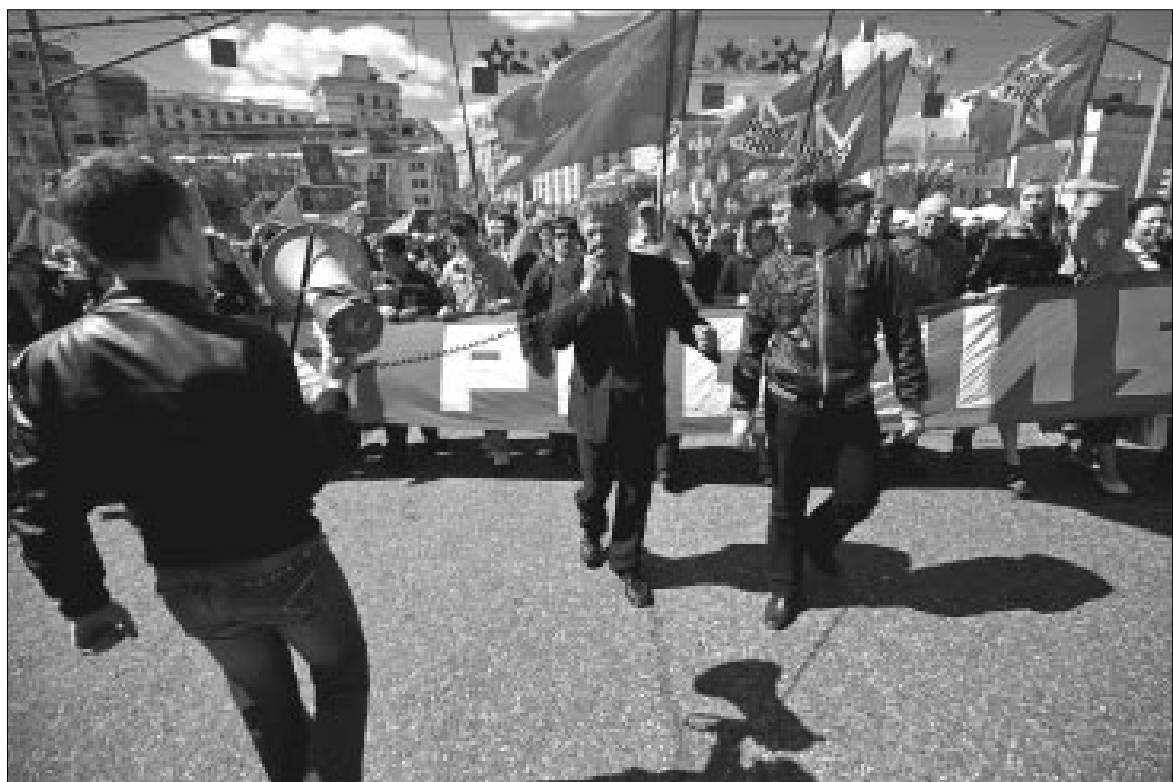
Праздничная колонна трудороссов.