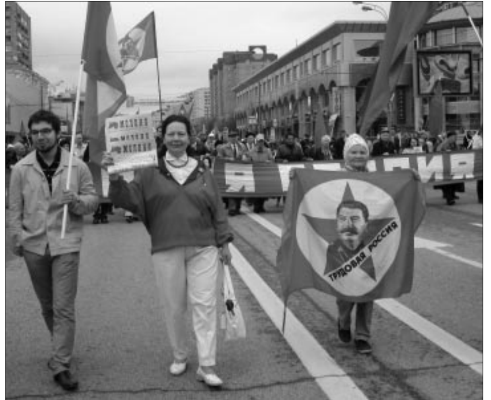
Ветераны и молодежь в первомайской колонне «Трудовой России» в Москве.

Исполком «ТР» поручает своему Председателю В.И. Анпилову в самое ближайшее время организовать встречу представителей организаций и движений, выступающих за восстановление конституционных избирательных прав граждан России в полном объеме.