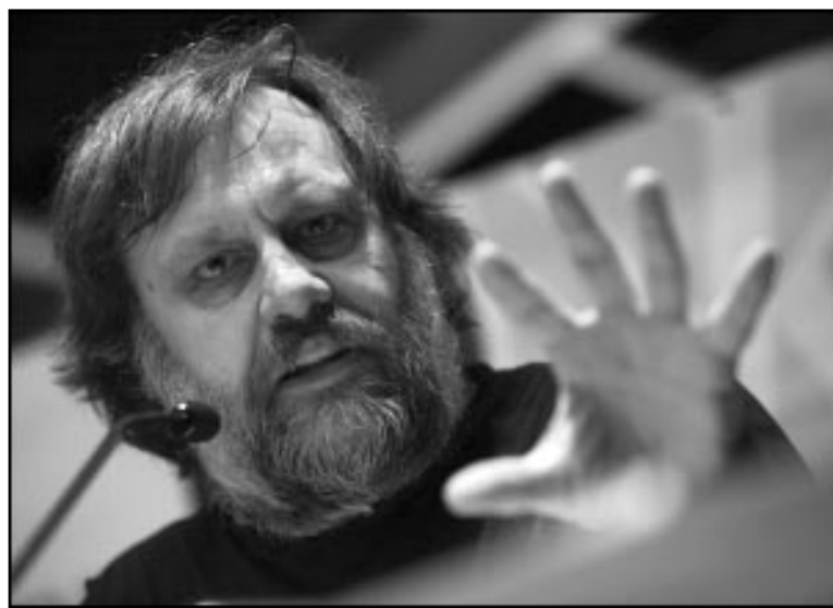
Славой ЖИЖЕК — знаменитый философ-марксист, автор популярного исследования «13 опытов о Ленине» о том, почему боятся арабского революционного духа.

Даже в случае явственно фундаменталистских движений нельзя упускать из виду, что и в них может быть социальный компонент. Талибан регулярно представляют как фундаменталистскую исламистскую группировку, которая реализует свою власть через террор. Между тем, когда весной 2009 года они захватили долину Сват в Пакистане, «Нью-Йорк таймс» сообщила, что они построили «классовое восста-