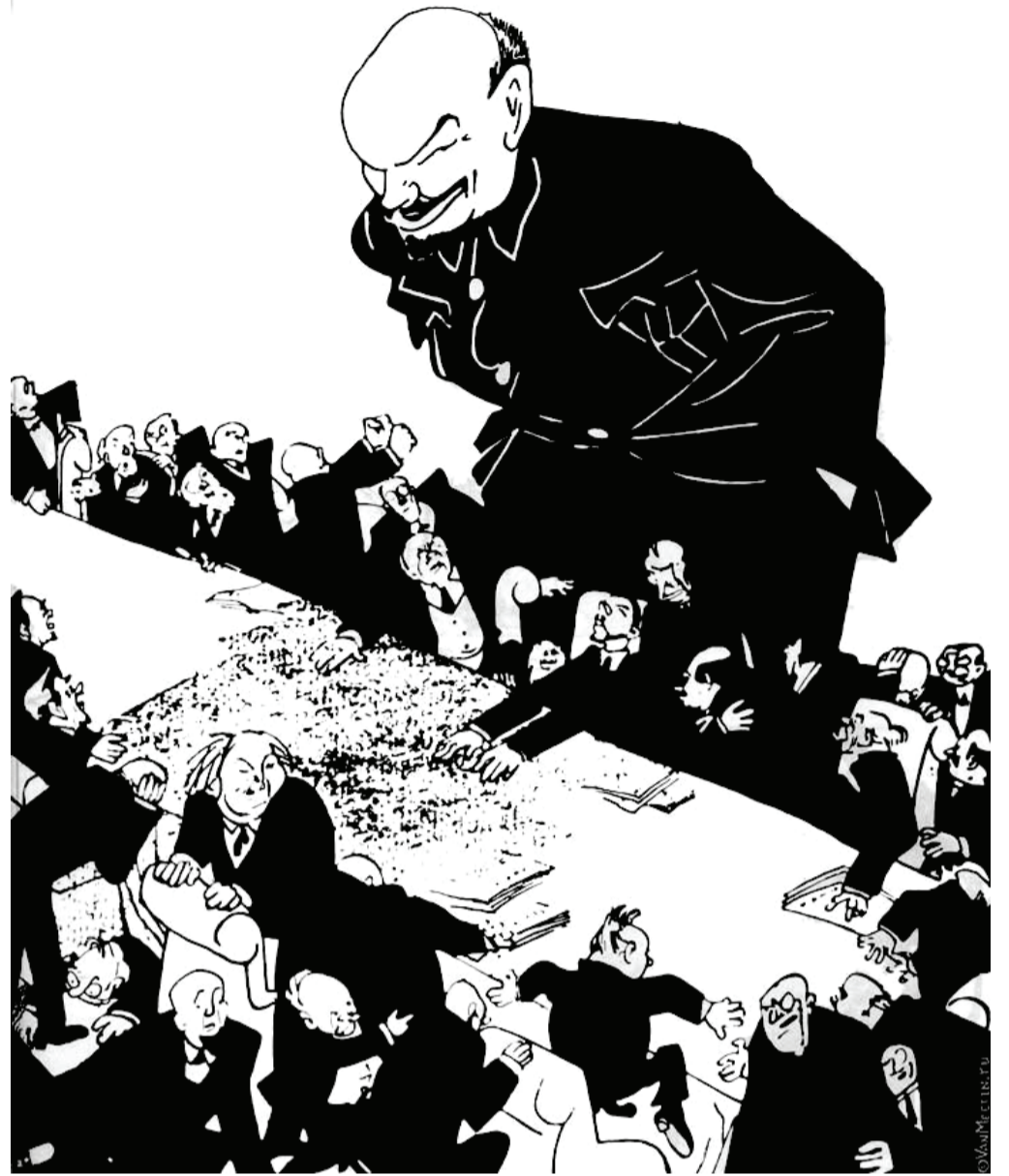
Появление товарища Ленина на заседании президентского совета по науке и образованию 21 января 2016 года.