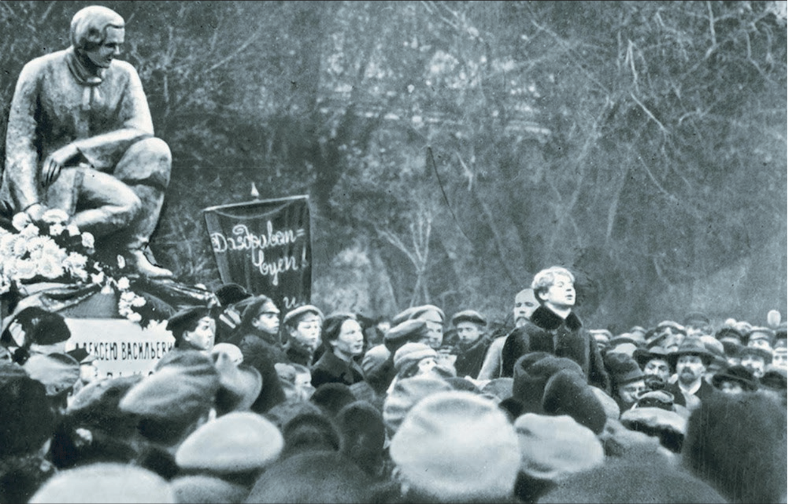
На фото: Сергей Есенин выступает на открытии временного памятника русскому поэту А.В. Кольцову у Китай-городской стены. Москва, 8 сентября 1925 года

В ночь с 27 на 28 декабря 1925 года не стало Есенина. «Он обернул вокруг своей шеи... веревку... выбил из-под ног табуретку и повис лицом к синей ночи, смотря на Исаакиевскую площадь».