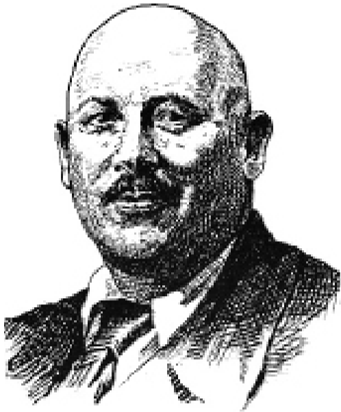
СЕМЕНА (из моего детства)

Самовар свистал в три свиста. Торопяся и шалая, Три румяных гимназиста Уплетали кренделя.